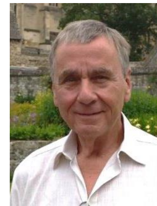
Her har du ham.

Ja da. Jeg henter det på distriktets hjemmeside.