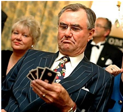
Prins Henrik "Skal jeg knibe eller ej?"

For at deltage i ovennævnte Grand Prix, skal man først igennem en kvalifikation. Her i distriktet bliver der afholdt to af disse.