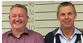
Distriktsmestrene slog til igen !

Da det hele var overstået så TOP-10 således ud: