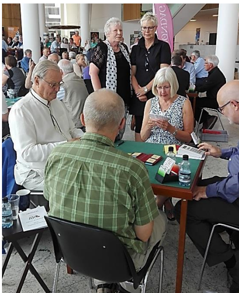
Dette var det nærmeste vi nåede HKH.