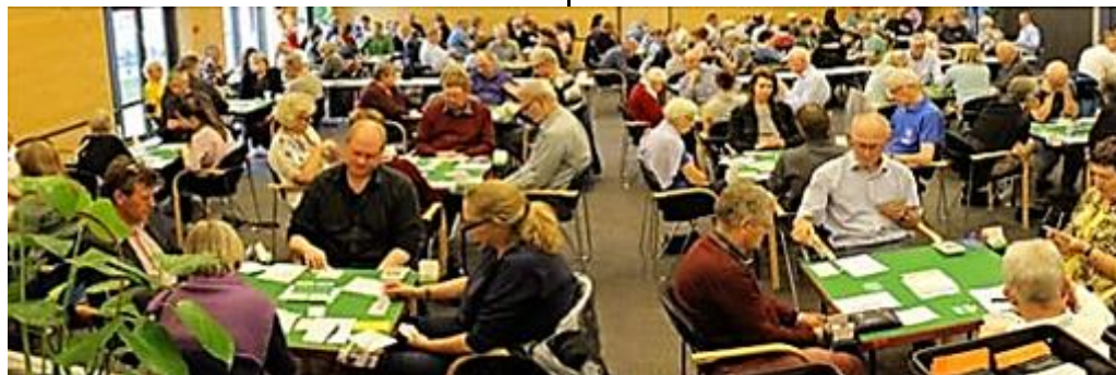
Et vue ud over salen (Meilands fra BK 83 ses ved bordet til højre)

Om søndagen spillede de fire øverste hold finalerunder, medens "rosset" fortsatte med 5 runder Monrad (i alt 40 spil) - Her skulle vi igen starte mod Raulunds hold, da de var endt på 11.-pladsen. Nu skulle de sikkert have hævn, men det lykkedes os sandelig at vinde igen - dog kun med 3 IMP !