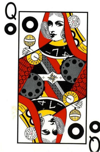
Samme serie, men er det spar?