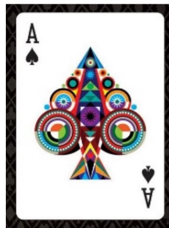
Et es af den dekorative slags.