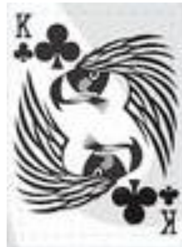
Fra ornitologernes VM ?