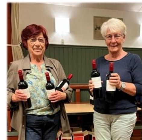
Lang tur, men det var turen værd