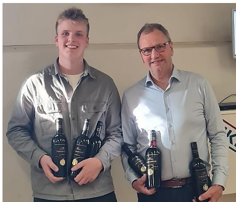
Kolding - far & søn endte på toppen

Jeg kikker altid efter eventuelle slemmer. Denne dag var der kun 2 ud af de 54 spil.